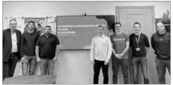
Gemeinde Roggenburg (Aufaktgespräch mit der Deutschen Telekom und Firma shala Bau GmbH)

Zwischenzeitlich steht fest, welches Bauunternehmen die Tiefbauarbeiten ausführt. Die Telekom hat die Firma shala-Bau GmbH aus Westhausen bei Aalen mit den Bauarbeiten beauftragt.