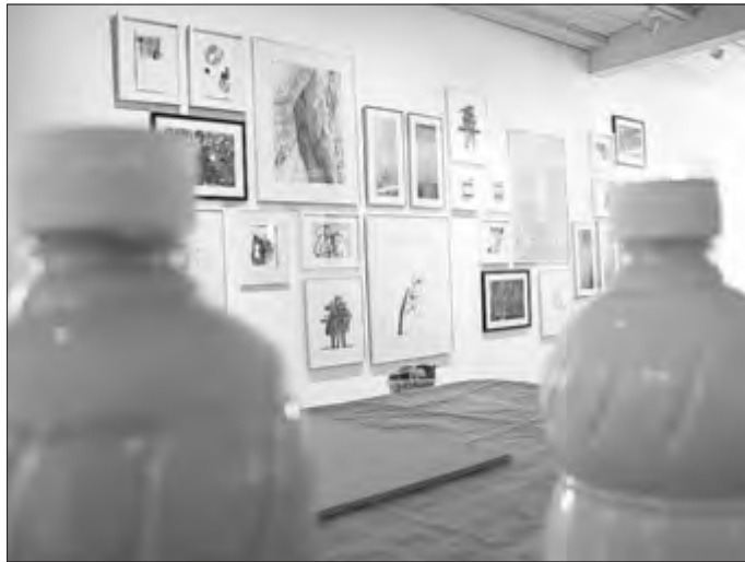
Das Museum für bildende Kunst lädt im März zu gleich zwei ausstellungsbegleitenden Veranstaltungen ein.

Weitere Informationen gibt es unter https://www.landkreis-nu.de/Museum-fuer-Bildende-Kunst-Oberfahlheim oder unter kreismuseen@landkreis-nu.de