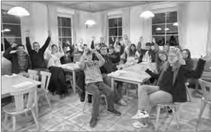
Das neue Jugendforum

Die dreijährige Amtszeit des Jugendforums Roggenburg ist zum Jahresende ausgelaufen. Die Vereine und Organisationen haben neue Mitglieder benannt, die sich zu Ihrer ersten Sitzung am 18.03.2025 im Haus der Vereine, Biberach, getroffen haben.